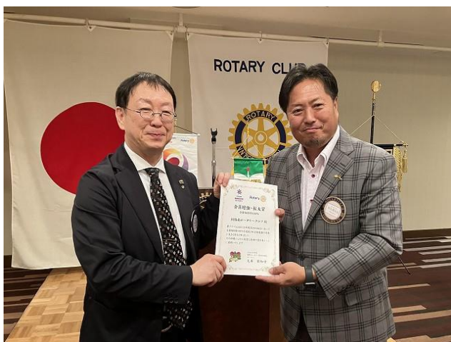
佐久間会員 拡大賞

なっております。当初、9月23日(土)を予定していた為、出席プログラム委員会で9月プログラム調整さんの日程を変更しております。ご記入がまだの会員様は、出欠のご記入宜しくお願い致します。なお、会員交流例会の詳細は後日、親睦活動委員会からお知らせが届きますのでご確認宜しくお願い致します。