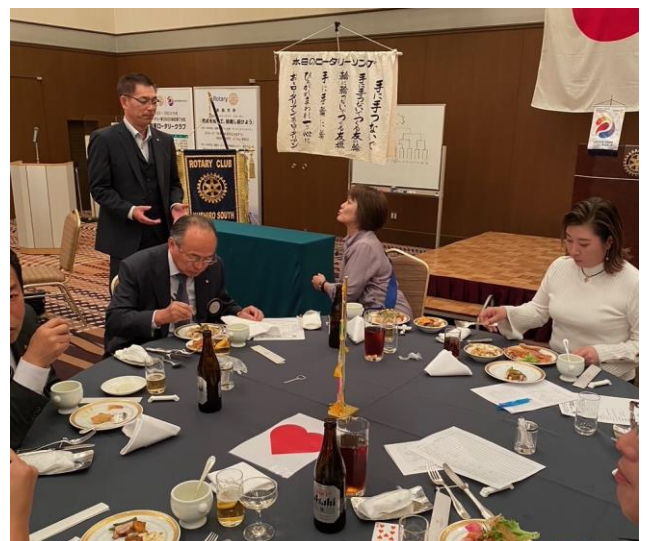
何かお願いこと・・・