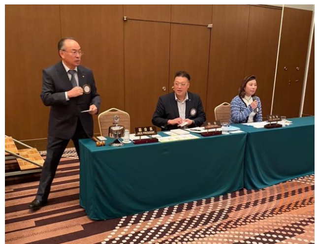
クラブの役員・・・