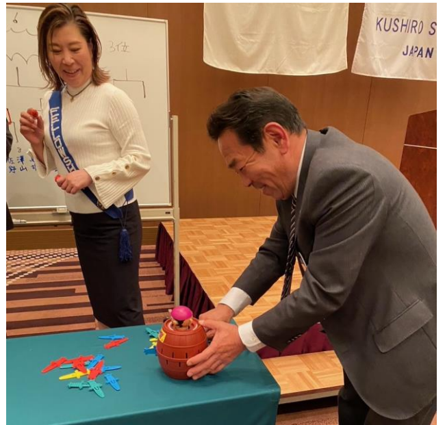
佐野会員笑顔・・・