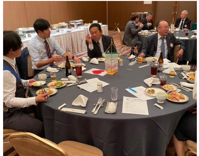
会員の談話・・・