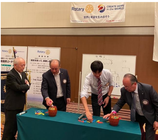
福井副会長 真剣です