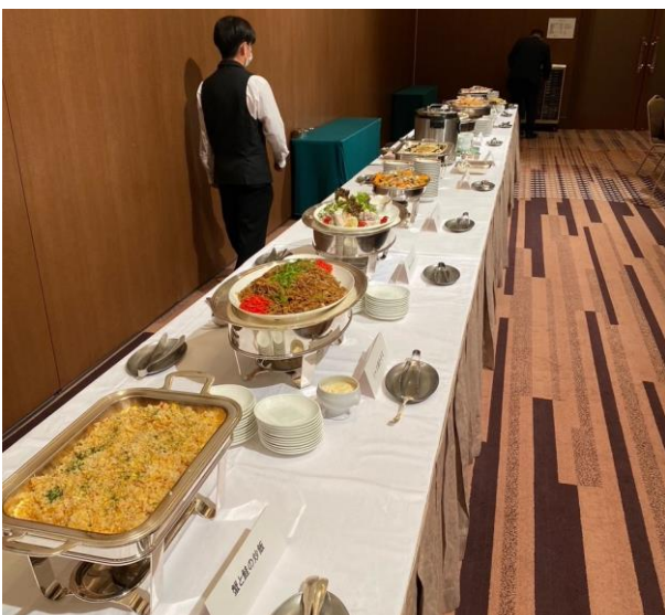
夜間例会 ビュッフェスタイルの数々