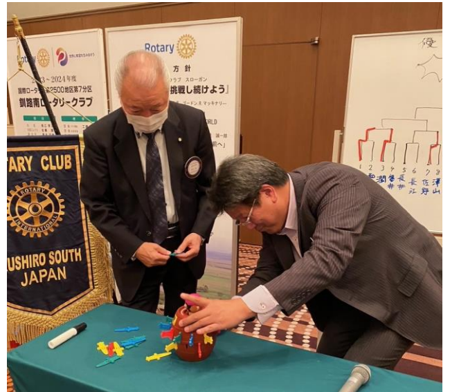
長江・長井会員真剣です