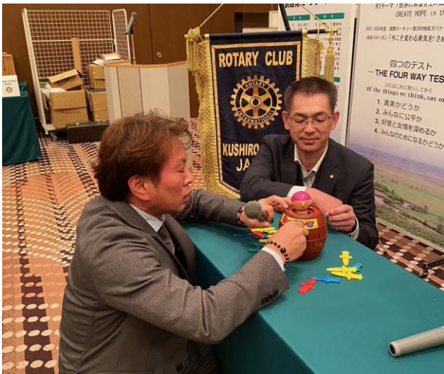
上川原・奈良会員怪しい・・・