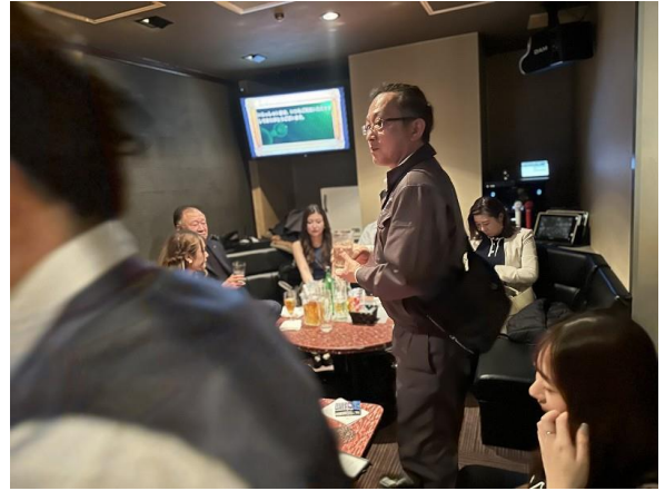
長倉パストガバナー補佐 締め音頭