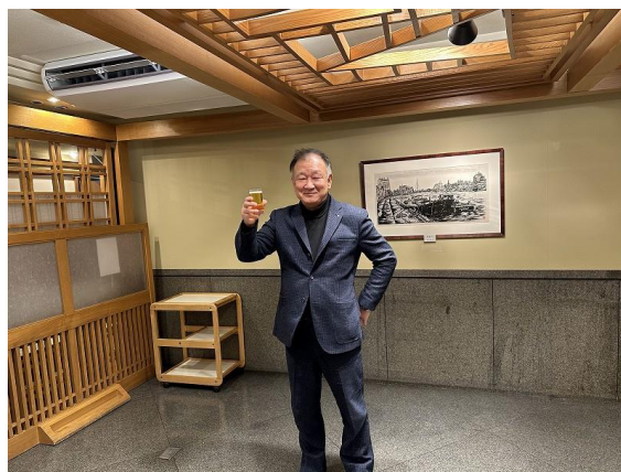
長倉パストガバナー補佐 乾杯の音頭 開宴