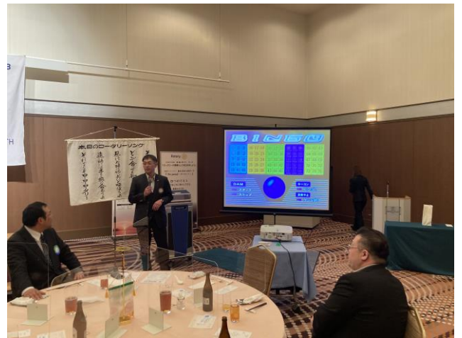
奈良親睦副委員長よりビンゴ大会の説明