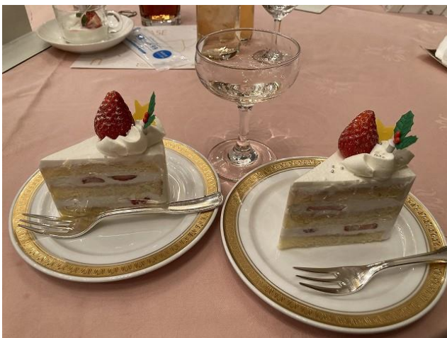
クリスマスなのでケーキもありました