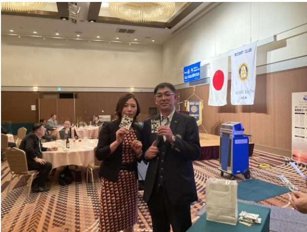
澤山幹事(左)と奈良会員(右)