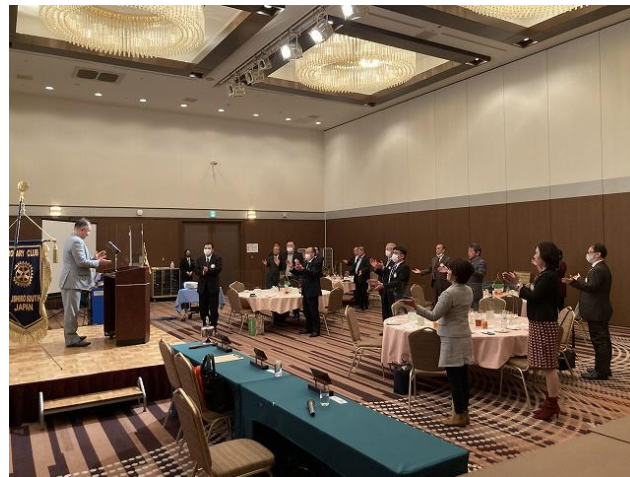
締めは一丁締めで