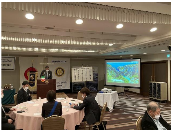
水と衛生月間に因んで(映像風景)