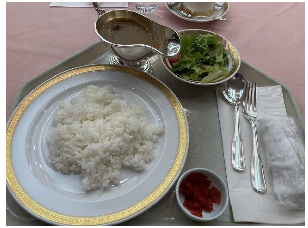
昼食 ビーフカレー