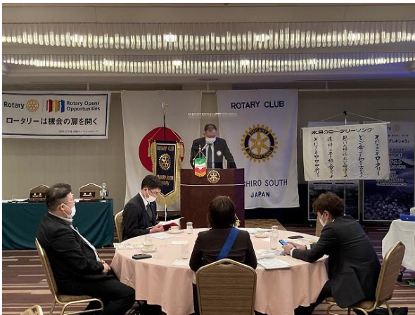
講話風景 (長倉会員)