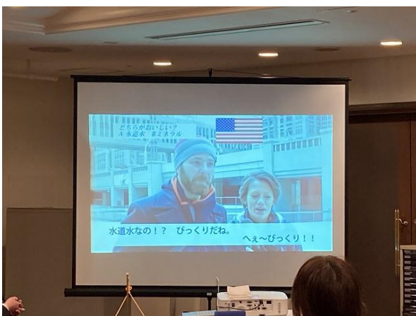
水と衛生月間に因んで(youtube)