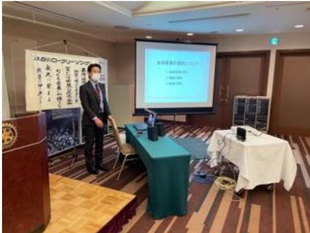
日本赤十字社挨拶