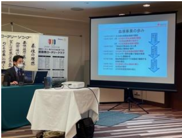
日本赤十字社講和