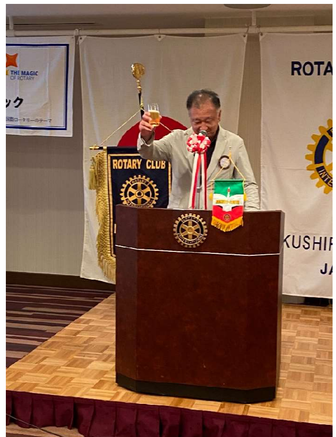
乾杯 長倉パストガバナー補佐