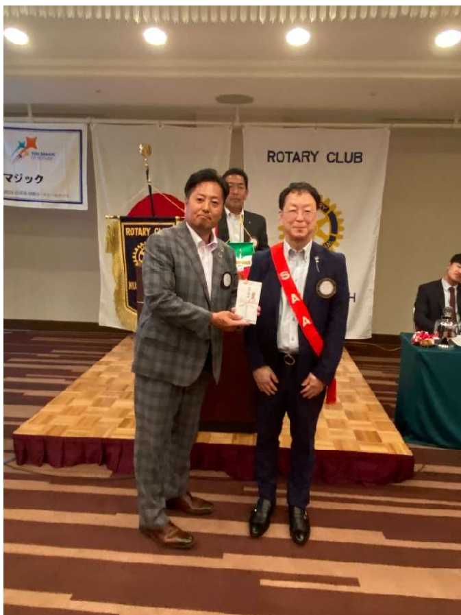
佐久間幹事 会員から会長、幹事へメッセージ