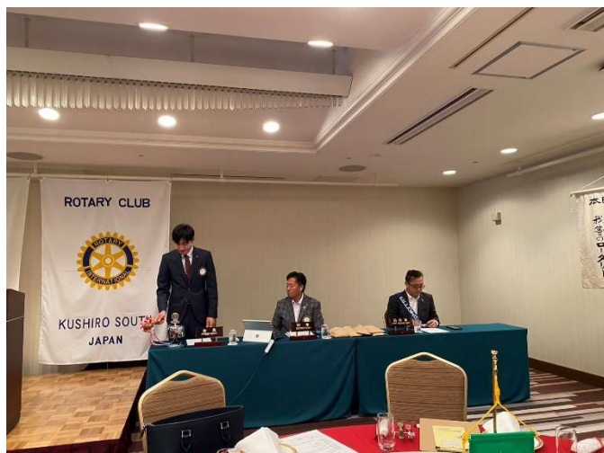
ロータリーソング