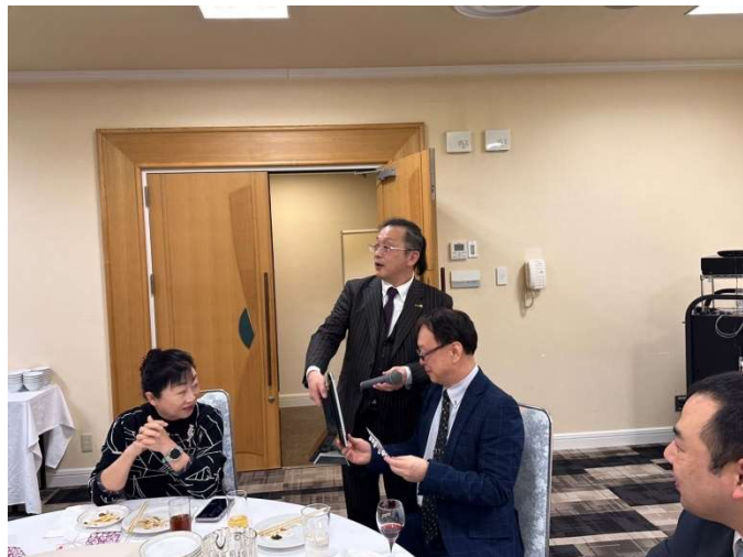
ビンゴ大会で盛り上がりました