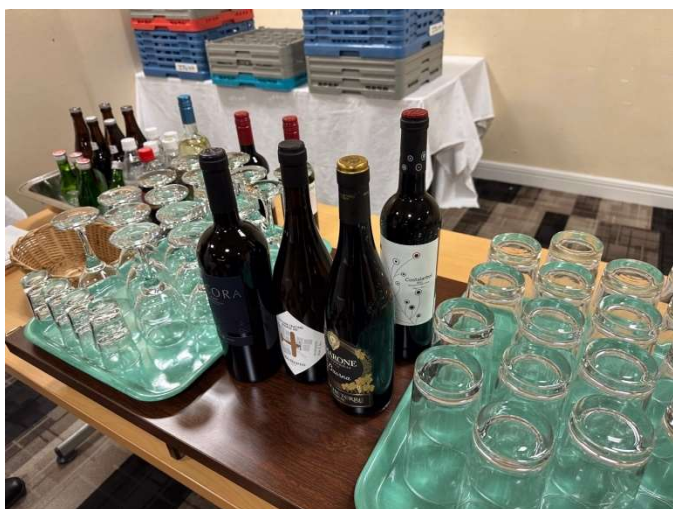
木内会員からの差し入れいつもありがとうございます