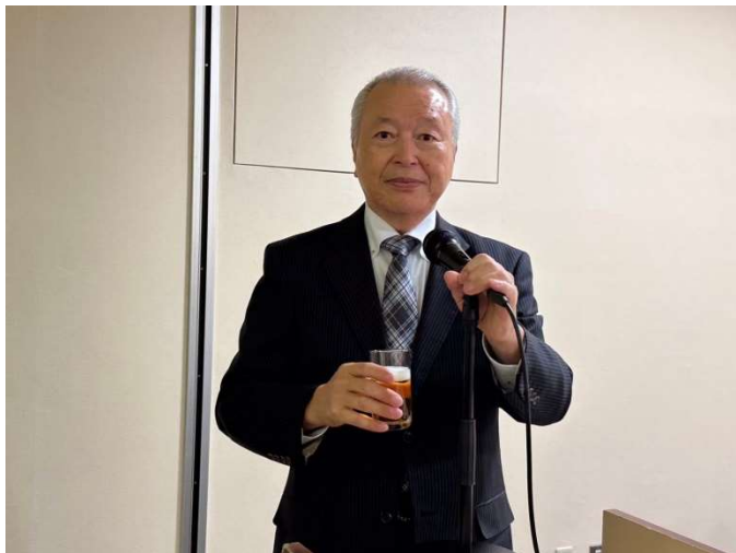
長江会員の乾杯で例会スタート