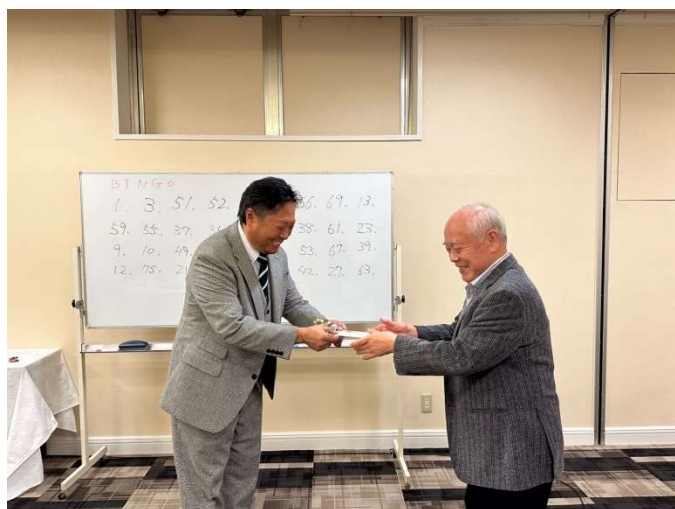
ビンゴ大会で盛り上がりました