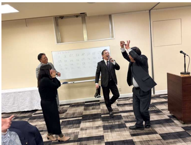
ビンゴ大会で盛り上がりました