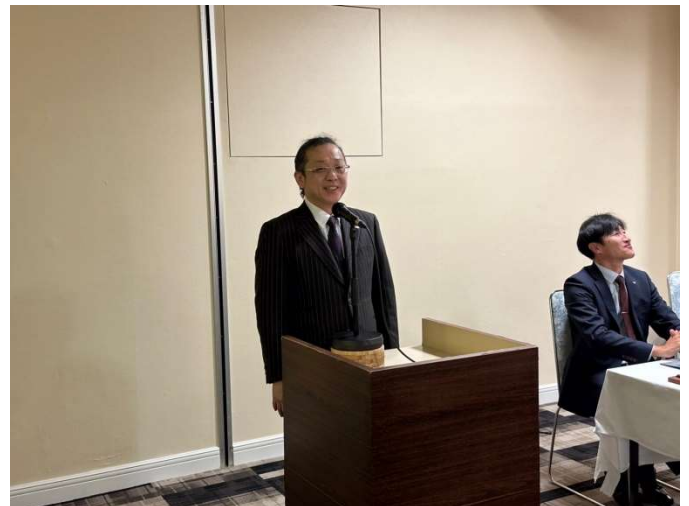
小向副委員長の司会進行